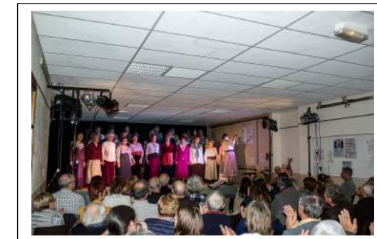
Spectacle Grande Guerre, Petites Gens... , à la salle polyvalente, le 25 novembre 2018

L'association compte s'investir dans le projet de valorisation et de protection des dolmens du Sud-Ardèche porté par la Communauté de communes des Gorges et auquel la commune vient de s'associer. L'ouverture d'un sentier est à l'étude autour des dolmens de Malbosc et du Chanet. Elle tient enfin à rester vigilante sur nos anciennes terrasses de culture et murettes en pierre sèche, autre fleuron de notre patrimoine bâti et paysager, particulièrement menacées par de nouveaux modes de production.