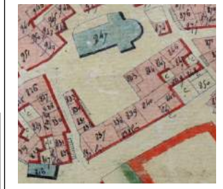
Fig. 12 : Extrait du cadastre Napoléon de Saint-Remèze, secteur du château.

Victime de la violence révolutionnaire, en partie masqué par l'église, reconstruite et agrandie au milieu du XIXe s., et défiguré par de regrettables ajouts du XIXe s., le château de Saint-Remèze a perdu de sa superbe. Il garde néanmoins les témoignages des grandes périodes de construction et de restauration des châteaux ardéchois : - le XIIIe s., avec son donjon médiéval enchâssé dans des constructions plus récentes, - la fin des guerres religieuses, avec sa partie intermédiaire autour du grand escalier, - le XVIIIe s., avec son grand et long bâtiment à deux étages, correspondant à ce nouveau souci de paraître loin des nécessités de la défense du Moyen Age. Le château n'a pas bénéficié d'une réintégration dans le giron familial comme à Vogüé, ni d'un rachat d'un mécène ou du département. Il fut touché pleinement par « l'expropriation hardie » de la vente des biens nationaux.