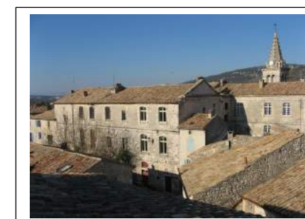
Fig. 7 : Le château de Saint-Remèze, côté sud.

le cimetière qui enserrait l'église autour du chevet et lance la construction d'une nouvelle aile parallèlement à l'église, doublant largement la superficie du château. Des modifications sont aussi portées sur la partie sud, côté avenue du général Leclerc, pour harmoniser le tout (Fig. 7 et 8). Il enclot la place au cœur du village avec son puits et fait bâtir une grande porte cintrée donnant sur un parc ou parterre au midi.