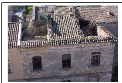
Fig. 1 : La toiture d'une partie du château début 2018.

Depuis quelques mois, le château de Saint-Remèze fait l'objet de réaménagements importants sur une grande partie de son bâti et de sa toiture, dans un piteux état avant le lancement des travaux (Fig. 1 et 2). Aussi, il nous semble opportun de rappeler l'évolution de ce monument qui se dresse au cœur du village, près de l'église.