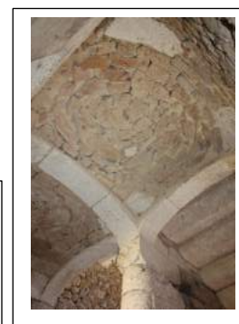
Fig. 6 : Les voûtains au-dessus des paliers de l'escalier d'honneur.