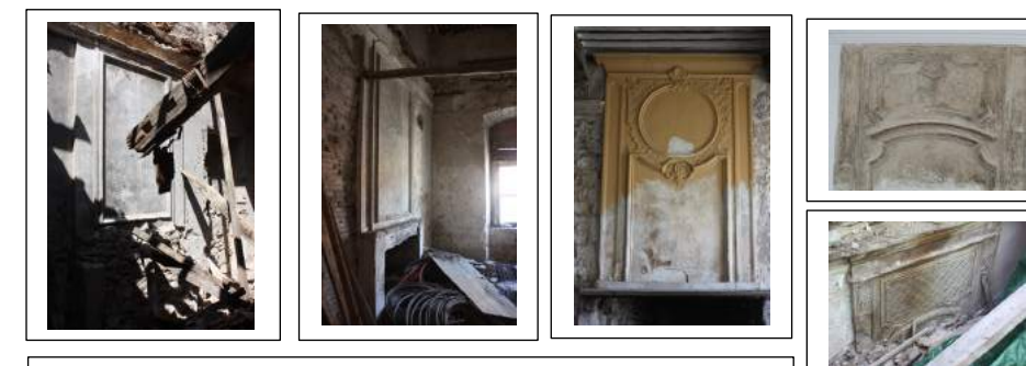
Fig. 9 : Exemples de trumeaux en stuc au-dessus des cheminées.

Sur le toit, des tuiles canal inscrites, façonnées à Saint-Marcel d'Ardèche, portent la date de 1724 correspondant à cette période de construction. On retrouve ce même millésime sur des carreaux de carrelage en céramique.