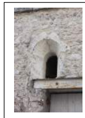
Fig. 11 : Une des baies de la chapelle récemment dégagée, au rez-de-chaussée dans l'angle NW du château.

Le cadastre Napoléon de 1829 restitue précisément le partage entre une dizaine de propriétaires pour le château proprement dit, une quinzaine avec les dépendances, entraînant des modifications et mutilations intérieures multiples. Il montre encore plusieurs constructions de maisons, de remises à l'est, place du Porgy (Fig. 12).