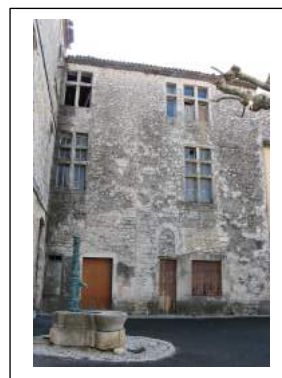
Fig. 3 : L'ancien donjon médiéval et les transformations du XVIIe s.

De cette place, à y regarder de plus près, on distingue à l'ouest les restes d'une vieille tour quadrangulaire (Fig. 3). Nous avons sans doute là l'ancien donjon ou tour maîtresse du premier château de Saint-Remèze, remontant au XIIIe s. Il présente sur sa face nord un mur bien appareillé avec des pierres à bossage dans les chaînages d'angle et inclut à 2 m du sol actuel une porte basse ogivale, conforme au principe des donjons de l'époque qui voulait que l'accès à la tour se fasse au premier étage par une échelle, le rez-de chaussée ou basse-fosse servant plutôt de magasin ou/et de prison. Il se développe sur deux étages avec des murs de plus d'un mètre d'épaisseur. Ce bâtiment devait être couronné d'une terrasse offrant une large vue sur la région environnante. Des échauguettes, dans le style de celles du donjon d'Aubenas, ont occupé les deux angles de sa face ouest comme l'attestent les tronçatures dans la maçonnerie ; elles datent probablement de la période suivante. On y voit aussi une longue gargouille qui devait récupérer l'eau de la terrasse ou de la toiture. Une meurtrière ouvrait sur cette même façade au niveau du premier étage. Les austères fenêtres à meneaux sont postérieures.