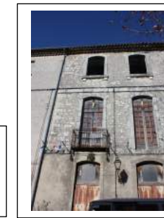
Fig. 8 : Détail de la façade, côté sud.

A l'extérieur, l'essentiel du château prend l'allure d'un long corps de logis classique avec de hautes fenêtres en anse de panier (Fig. 2). A l'intérieur, c'est toute une distribution de grandes pièces, mais surtout de chambres, de petits salons, de cabinets et boudoirs. De nombreuses cheminées en pierre ou marbre étaient présentes. Les trumeaux en stuc qui pour la plupart enserraient des miroirs sont à simple cadre mouluré en relief ou à encadrement plus fantaisiste de style Régence avec des éléments décoratifs qui se retrouvent fréquemment pour cette période (1715-1723) : un fond de quadrillé à rosettes, la coquille, le lambrequin, les fleurons (Fig. 9). Plusieurs plafonds sont « à la française », comme dans la grande salle du premier étage, mais la plupart sont des plafonds unis à corniche moulurée (Fig. 10).