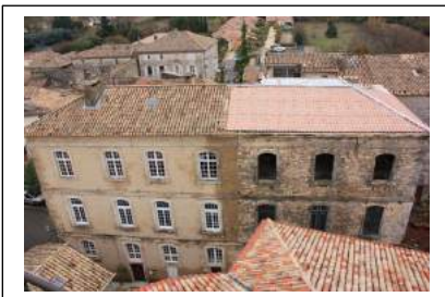
Fig. 2 : Les travaux en cours fin 2018.

Il apparaît surtout dans son état du XVIIIe s., sous l'allure d'une massive bâtisse s'élevant sur trois niveaux, aux murs crépis, desservie par un escalier à double volée ouvrant sur la Place du château (Fig. 2).