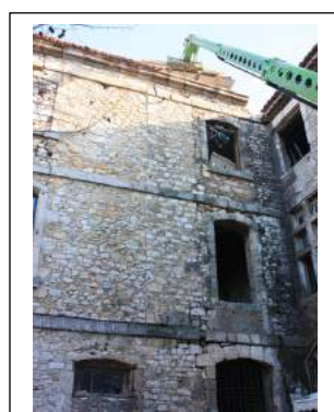
Fig. 4 : La façade au niveau de l'escalier. Le contact XVIIe / XVIIIe s.

Ce château s'élevait en plaine tout près de l'église Saint-Remi ( Remézy ), attestée dès l'an 877 et relevant de l'Église cathédrale de Viviers, probablement à l'origine du développement du village. Il a été la demeure des premiers seigneurs de Saint-Remèze et c'est sans doute là que furent signées plusieurs transactions et ventes des Baladun et Chateaufort-Randon pour les XIIIe et XIVe s. (P.-Y. Laffont, 2004).